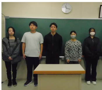
↑ 新生徒会役員の皆さん

今回から、2年次が生徒会の中心となります。行事等の企画・運営など様々な場面において、活躍が期待されます。